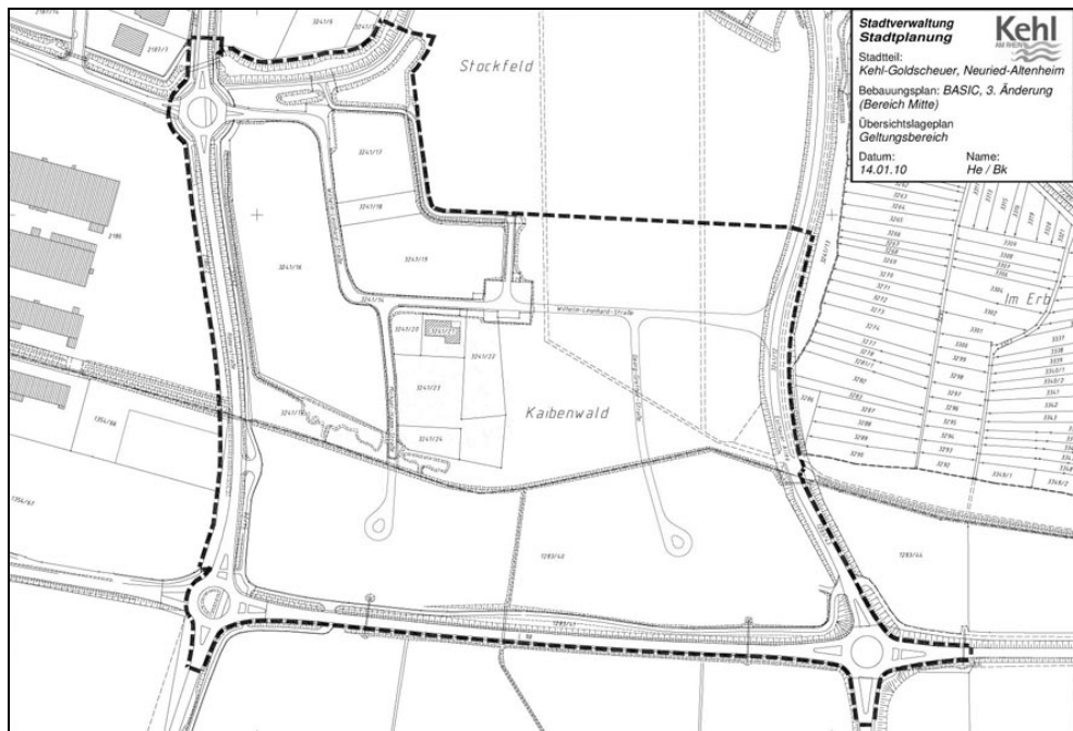
Abb. 1: Geltungsbereich der dritten Bebauungsplanänderung