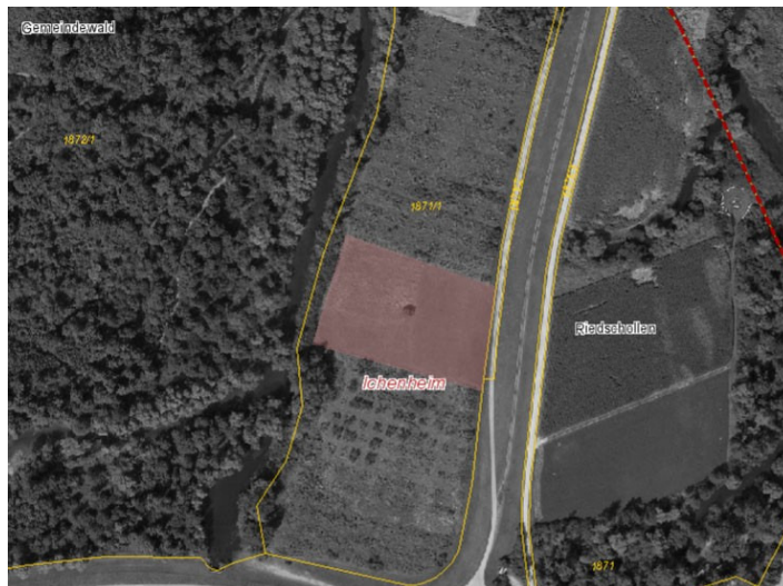
Abb.: alternative Aufforstungsfläche

Da diese Fläche nicht mehr zur Verfügung steht, wurde im Rahmen der 4. Änderung eine alternative Fläche gesucht: Es handelt sich bei der Fläche um 5.000 m 2 des Flurstücks 1871/1, Gemarkung Ichenheim. Sie ist naturschutzfachlich geeignet, da es sich um einen Lückenschluss bereits bestehender Aufforstungsfläche handelt.